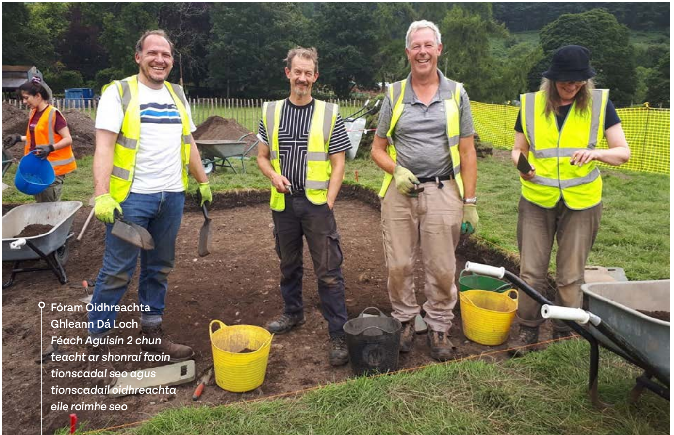
○ Fóram Oidhreachta Ghleann Dá Loch Féach Aguisín 2 chun teacht ar shonraí faoin tionscadal seo agus tionscadail oidhreachta eile roimhe seo