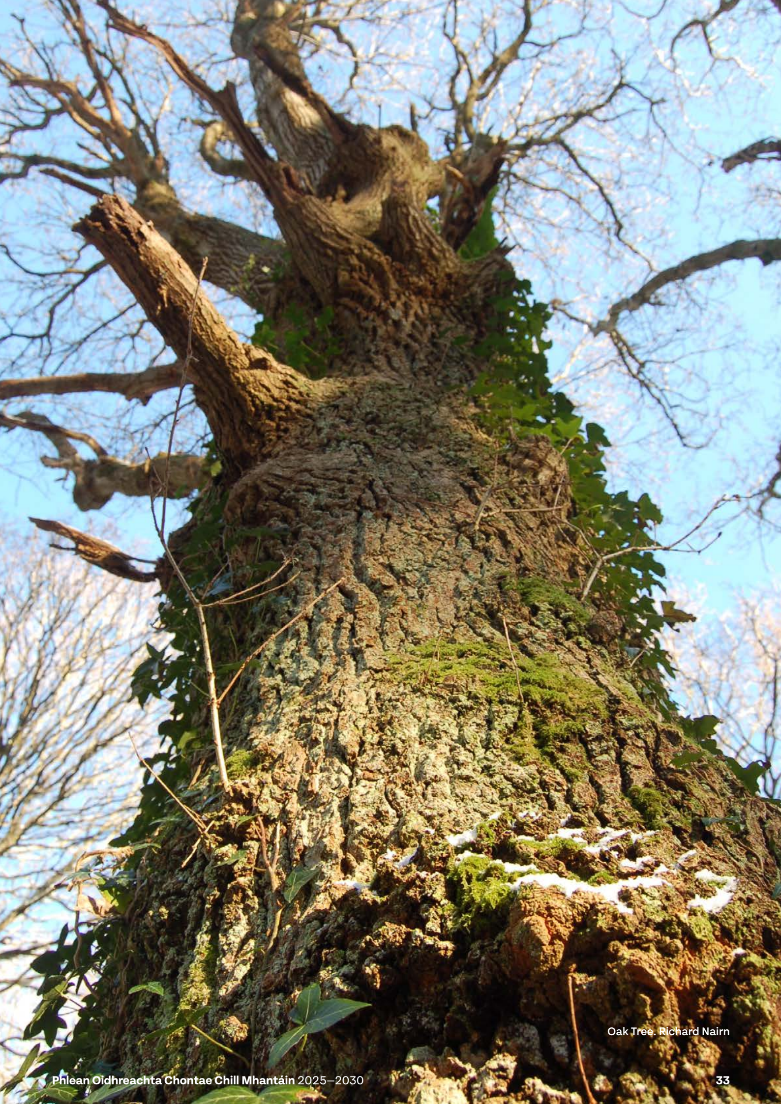
Oak Tree. Richard Nairn