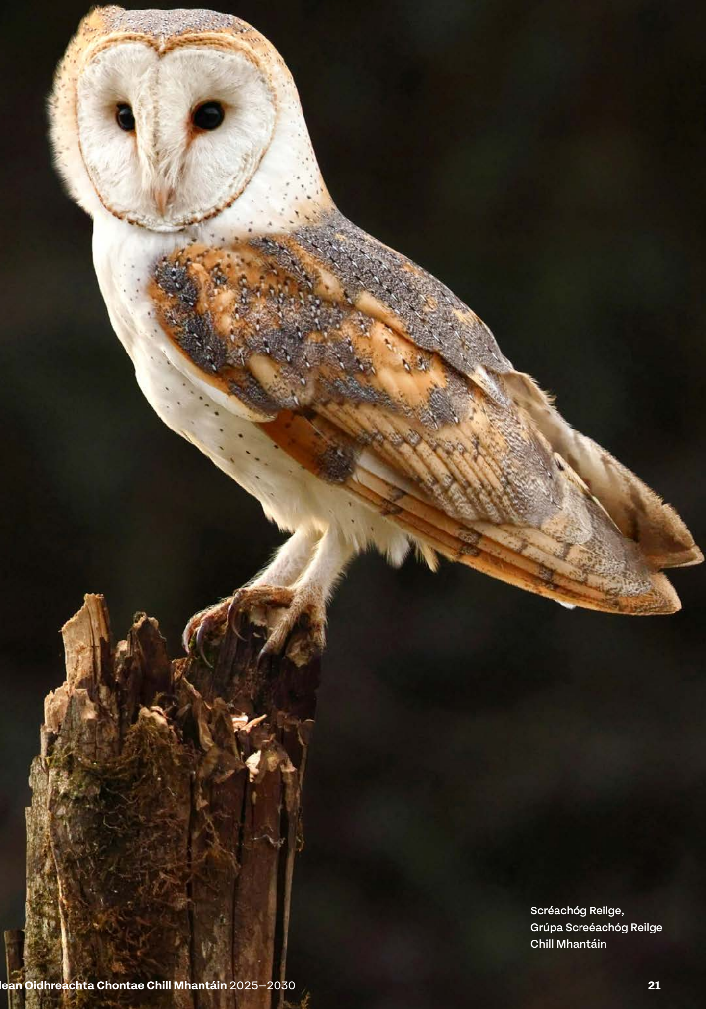
Scréachóg Reilge, Grúpa Scréachóg Reilge Chill Mhantáin